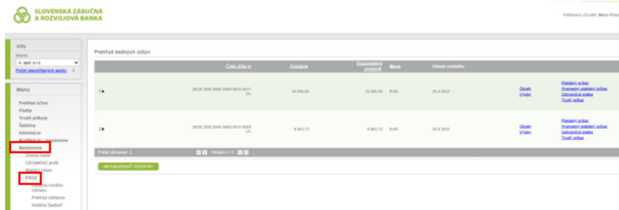
Obrázok č. 1