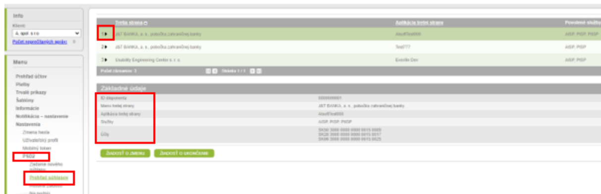
Obrázok č. 4

5.2. Na začiatku každého zobrazeného riadku je grafický prvok ► (obrázok č. 4), pomocou ktorého si otvoríte detail súhlasu.