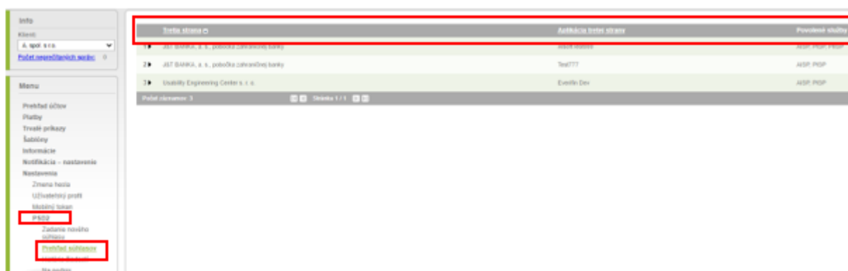
Obrázok č. 3

Štruktúra prehľadu (obrázok č. 3) „ Prehľad súhlasov “ - obsahuje nasledujúce stĺpce: